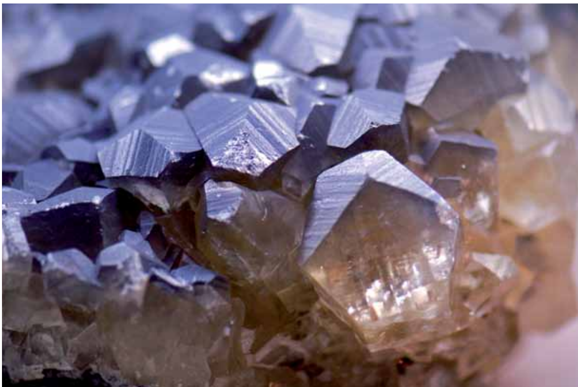
Kvarc – a kötőanyagként használt vízüveg, vagy más néven kálium-szilikát alapanyaga