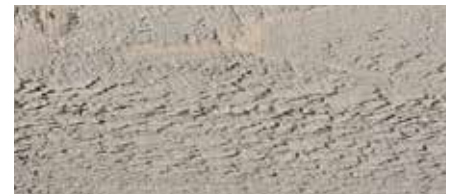
Kolor nr 4870