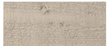
Kolor nr 4832-M