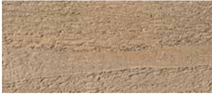
Kolor nr 4470