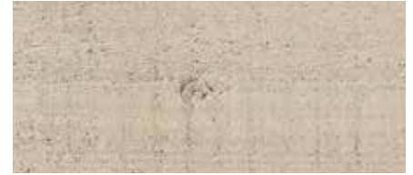
Kolor nr 4832