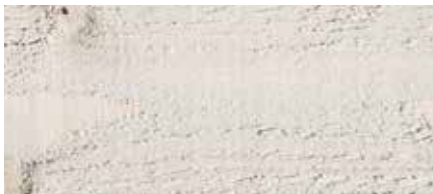
Kolor nr 4861