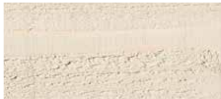
Kolor nr 4863