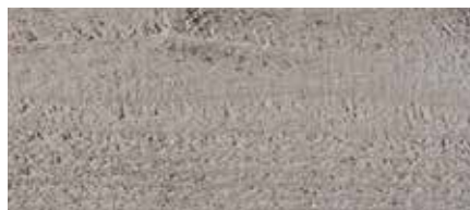
Kolor nr 4880