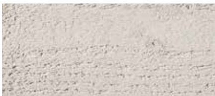
Kolor nr 4875