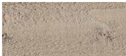
Kolor nr 4470-M