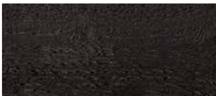
Kolor nr 4895