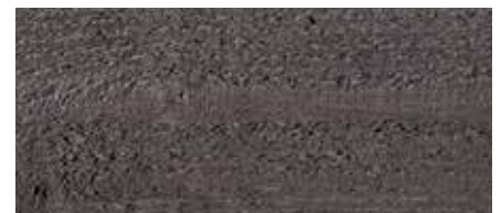
Kolor nr 4890