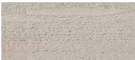
Kolor nr 4259-M