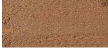
Kolor nr 4735